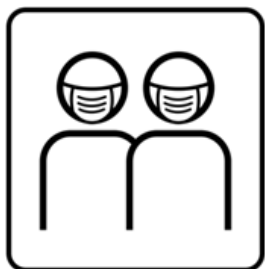
Wenn Abstandhalten nicht möglich ist, ist das Tragen eines Mundschutzes empfohlen