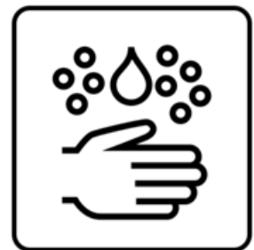
Gründlich Hände waschen