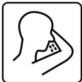
In Taschentuch oder Armbeuge husten und niesen