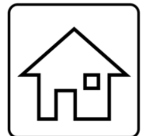
Bei Symptomen zu Hause bleiben

Der Vorstand des Schweizerischen Schafzuchtverbandes dankt für die Einhaltung der Regeln und wünscht eine erfolgreiche Schausaison.